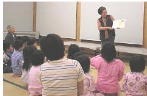
絵本のよみきかせ